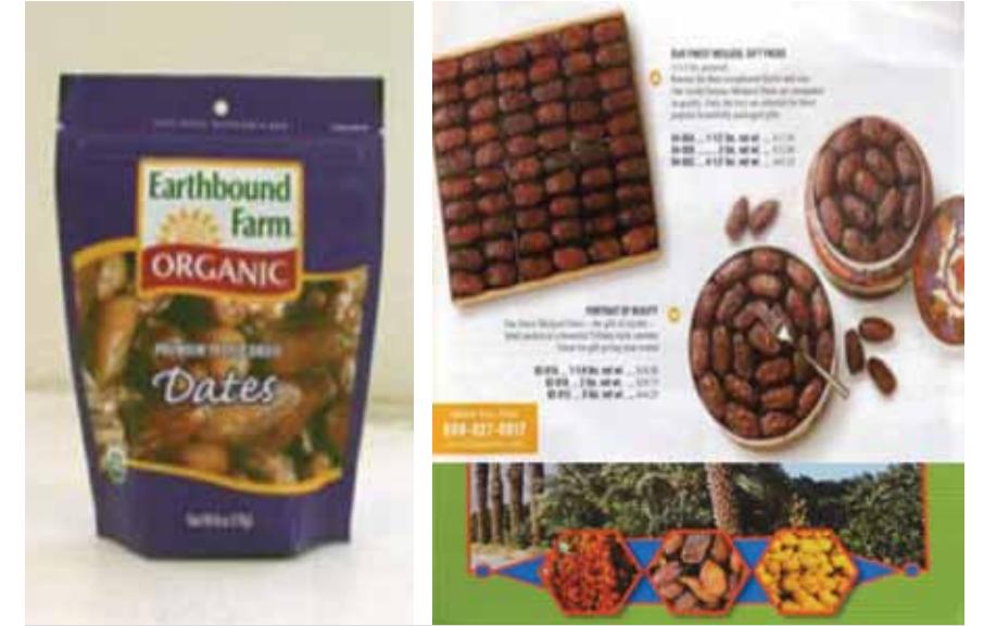
صورة رقم 3. التعبئة للتمور في عبوات متنوعة و متميزة تحقق رغبات المستهلكين في امريكا

10 - النخيل المزروع في امريكا تطبق عليه نظام الممارسات الزراعية الجيدة او الجلوبال جاب او الزراعة النظيفة. و ايضا يوجد كثير من المزارع التي تستخدم نظام الزراعة العضوية اي بدون استخدام اسمدة كيميائية او مبيدات كيميائية او أي مواد او معاملات تضر في صحة الانسان و تؤثر على البيئة. حيث ان وزارة الزراعة الامريكية تطبق انظمة الزراعة المستدامة التي تحافظ على المصادر الطبيعية و تهتم بصحة الانسان و سلامة البيئة.