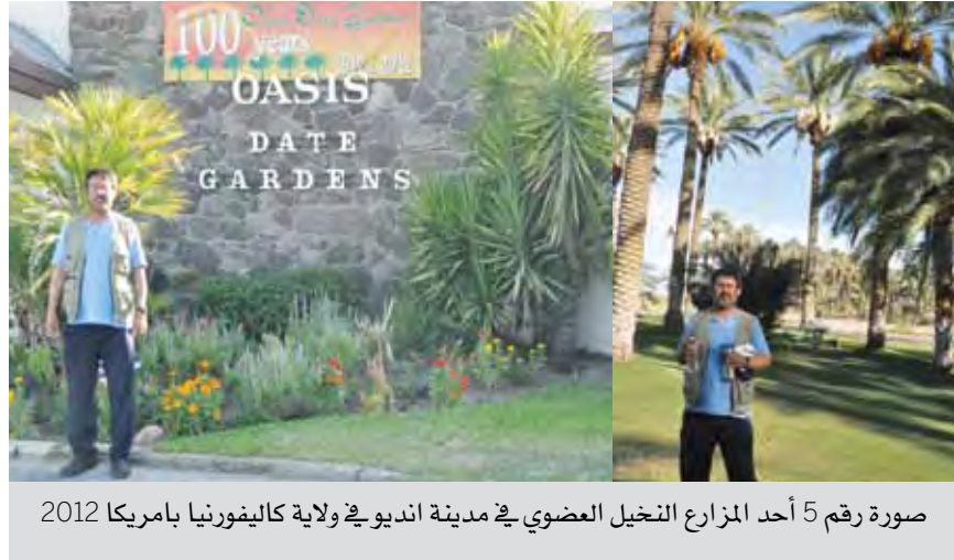
صورة رقم 5 أحد المزارع النخيل العضوي في مدينة انديو في ولاية كاليفورنيا بامريكا 2012

3 - بعض المواقع في الانترنت وخاصة موقع الجمعية العلمية للتاريخ في مدينة انديوا في كاليفورنيا وموقع وزارة الزراعة الامريكية وجامعة كاليفورنيا واريوزونا.