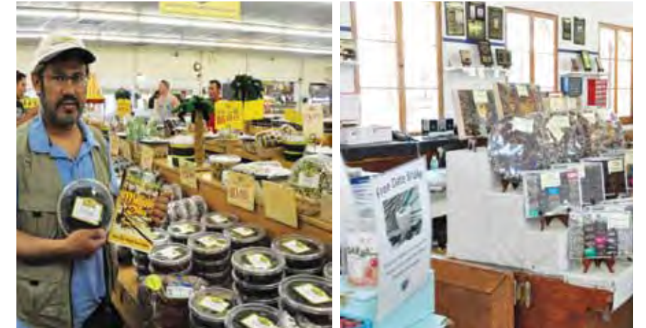
صورة رقم 4 محلات بيع التمور في مدينة انديو في ولاية كاليفورنيا في امريكا سنة 2012

6 - يدخل التمر في اكثر من 200 وصفة او طبخة غذائية في امريكا، حيث ان كثير من محلات بيع التمور المتخصصة في جنوب كاليفورنيا و اريوزونا و تكساس تقدم اصناف متنوعة من الاغذية المحتوية على التمور منها العصائر و الآيسكريم المكونة من التمر، و ايضا وجود التمر في كثير من الاسواق و محلات بيع الاغذية في جميع