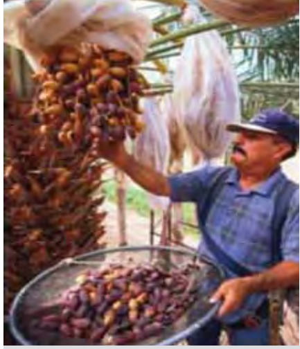
صورة رقم 1 حصاد التمور في كاليفورنيا في امريكا